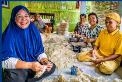
Mimin Among Indonésie